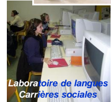
Laboratoire de langues Carrières sociales