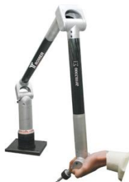
Bras de mesure 3D articulé Contrôle de pièces par contact.