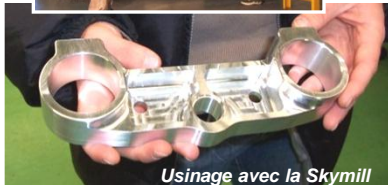
Usinage avec la Skymill