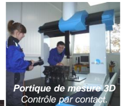
Portique de mesure 3D Contrôle par contact.