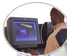
Salle de CAO mécanique CMTA V5